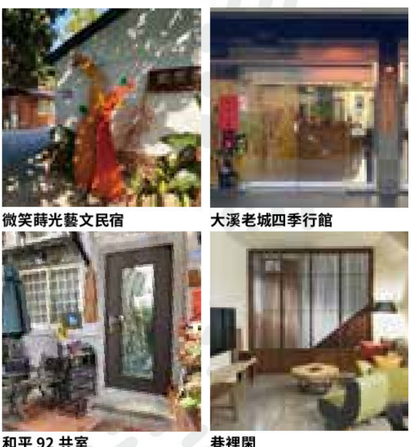
微笑時光藝文民宿 大溪老城四季行館 和平92共室 巷裡間

愜意享受一夜好眠。不論是住進老城內或休區內優質民宿，體驗靜謐夜涼風與晨起市場的喧鬧活力。跟著老城脈動，在大溪留宿一晚，更能感受老城簡樸生活味。