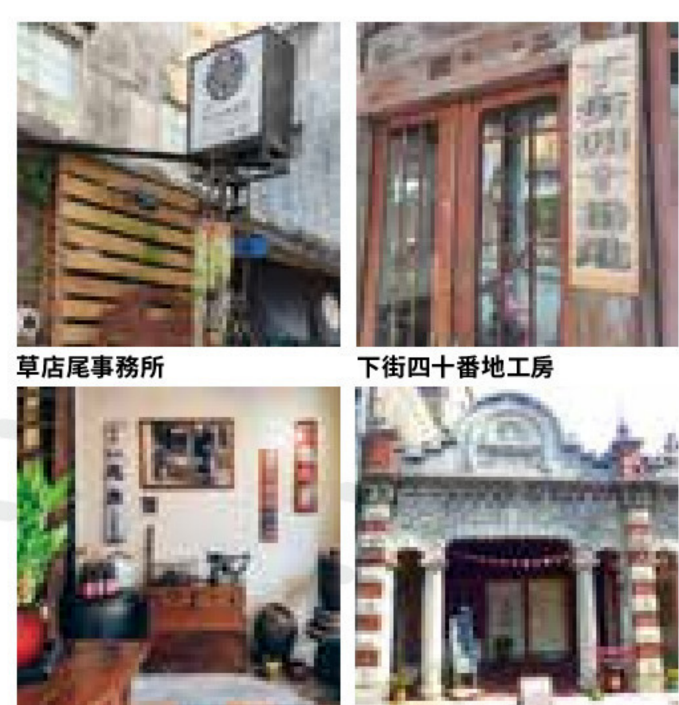
草店尾事務所 新南12文創實驗商行 源古本舖 新南12文創實驗商行

見證大溪老城的蛻變與延續。在地手作商品及料理令人行足，古宅活化成為藝文展示空間，老街屋內空間更是觀覽時代話彙最佳所在。融入閩南及巴洛克的街街建築外觀迷人，