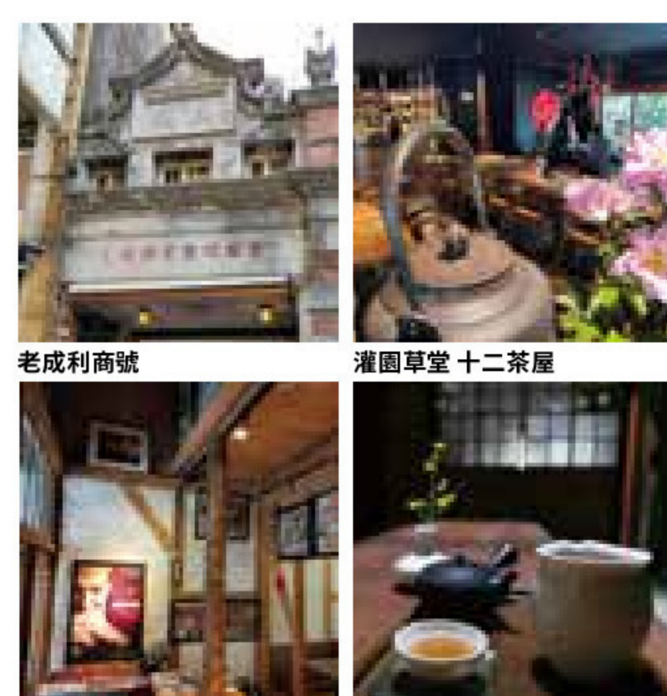
老成利商號 灌園草堂十二茶屋 蘭室茶坊 解放咖啡館

從容享受老城的美好風貌。用老城的慢步調，啜一口職人咖啡或品一盞茶，巷弄間茶坊、咖啡館為老屋注入新生命，老街雕花牌樓可見時光軌跡，