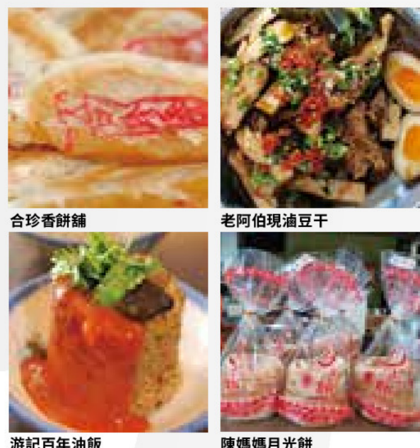
合珍香餅舖 老阿伯現滷豆干 游記百年油飯 陳媽媽月光餅

等待旅行者一同來品嚐。黑豆干、月光餅承載著老城歷史與代代相傳好滋味，百年風華淬鍊經典食飲，經歷三百多年歲月洗禮的大溪老城，