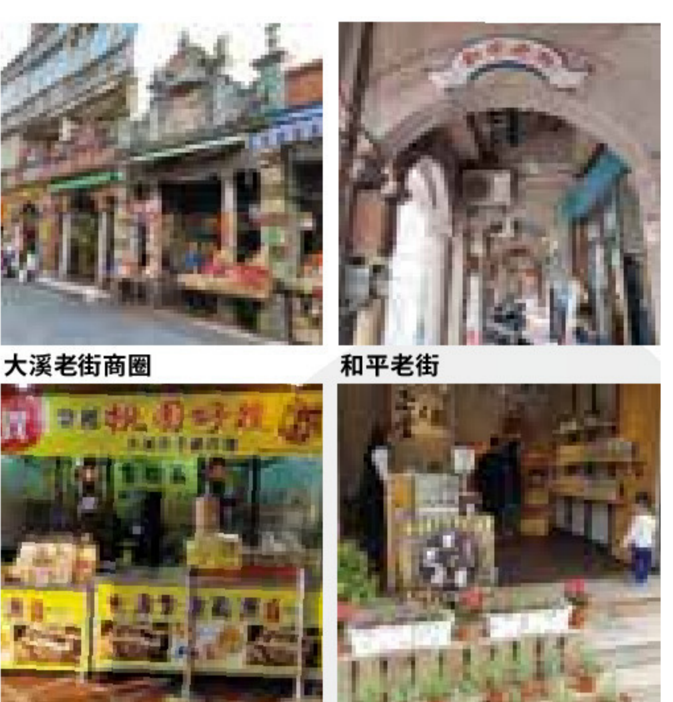
大溪老街商團 和平老街 大溪老街商團 大溪老街商團 大溪老街商團

延續美好旅程持續回味吧！精緻的爆米香或拿破崙派，別忘再帶點老城好味，也能透過傳統手藝與食飲，五感體驗、深刻感受。遊逛大溪老街除了透過老屋一窺大溪繁華過往，