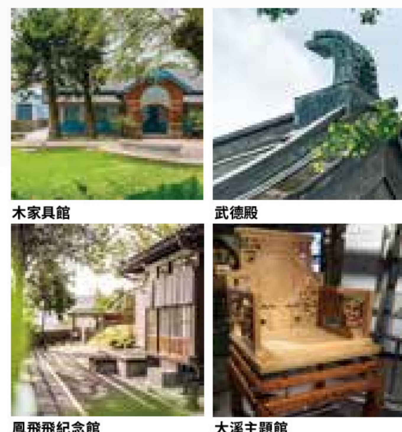
木家具館 武德殿 鳳飛飛紀念館 大溪主理館

沿普濟路綠意廊帶漫步，品味大溪宜人新風貌。訴說大溪百年發展、木藝風華、信仰文化，成為木博館館舍群，日式老屋、武德殿、公會堂與蔣公行館華麗轉身，大溪溪畔涼風吹來，河階上、老街鄰近，