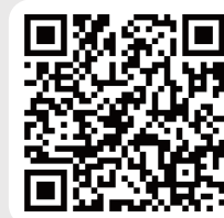
등연산 라인 음성 가이드